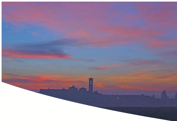
Rievocazione Storica di fine XV° secolo alla Badia di Dulzago 17-18 maggio 2013