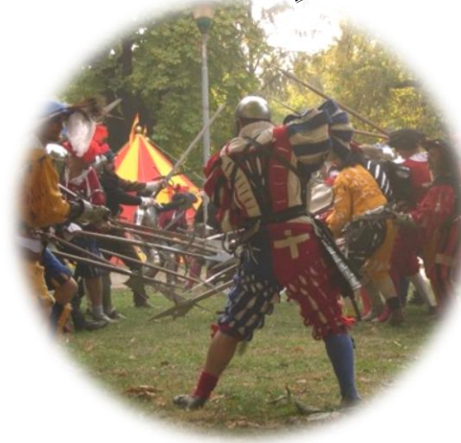
Rievocazione Storica di fine XV° secolo alla Badia di Dulzago 17-18 maggio 2014

Nella suggestiva località della Badia di Dulzago sarà possibile tornare indietro nel tempo fino al 1500, dove gli eserciti milanesi degli Sforza si scontrarono con gli invasori francesi. Accampamenti mercenari ed il loro seguito animeranno l'intero abitato con duelli, battaglie e dimostrazioni per contendersi il dominio della fertile terra dell'Abazia.