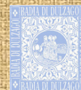
Comunità della Badia di Dulzago